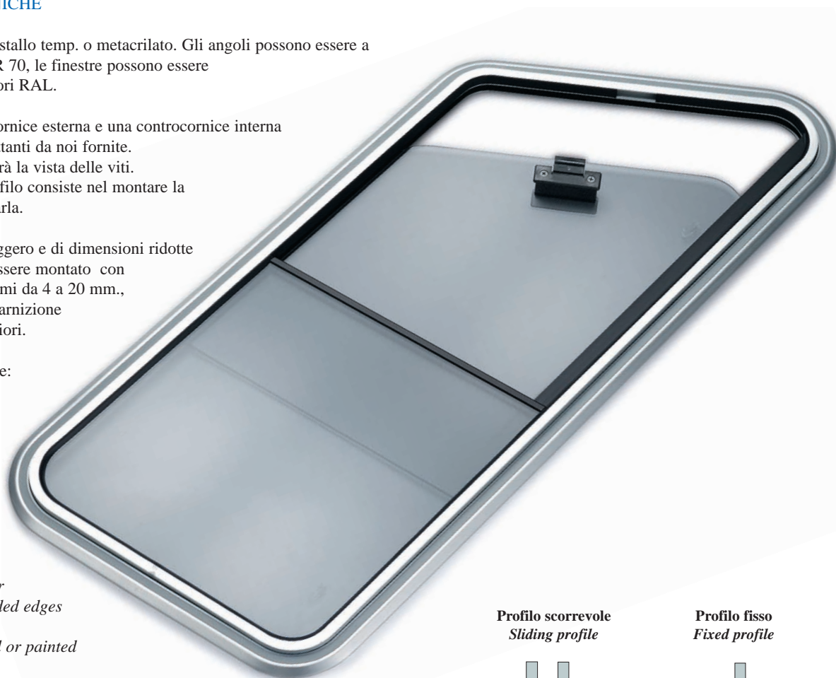
Profilo scorrevole Sliding profile

The windows can be: Fixed, 1/2 sliding, opening at bows. Any shape or dimension allowed